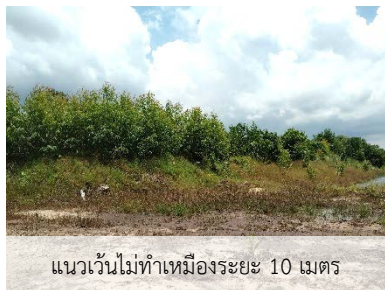
แนวเวนไม่ทำเหมืองระยะ 10 เมตร