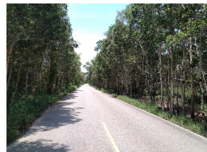
เส้นทางเข้าสู่พื้นที่โครงการ