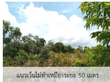
แนวเวนไม่ทำเหมืองระยะ 50 เมตร